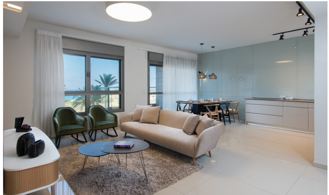
דירה מחהטת לדוגמא. פרויקט ויסטה נתניה